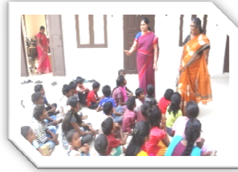
Our Women's Fellowship Members