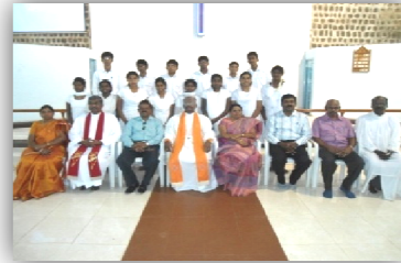
Confirmation – 2014