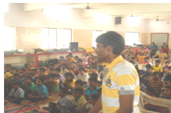
Special Programme for the Children of Hope for the Hopeless